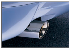
COX Stainless Muffler