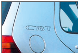
■ Side C18T Decar