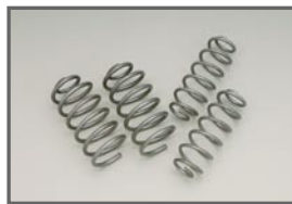
COX Original Spring Set