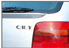
■ Rear C18T Emblem