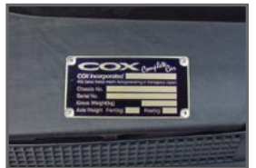
■ Engine Room Plate