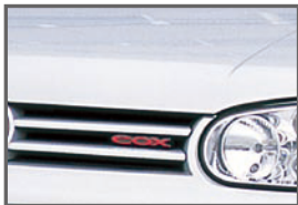
■ COX Emblem (Red)