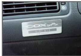
■ Interior Plate