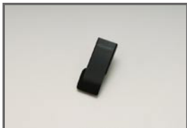
COX Accele Pedal Cover