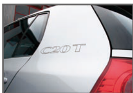
■Side C20T Sticker