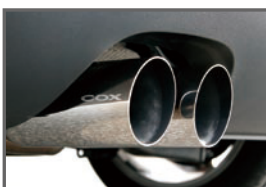
COX 2pcs Muffler