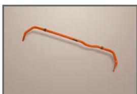
Rear Stabilizer (22φ)