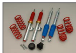
SACHS Racing Suspension Kit (Setting by COX)