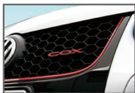
■Front COX Emblem (Red)