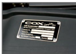
■Engine Room Plate