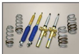
COX SS-3 Kit