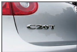
■Rear C20T Emblem