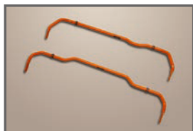
Front Stabilizer(24φ) Rear Stabilizer (22φ)