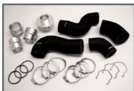
■COX H/D Turbo Pipe (4pcs)