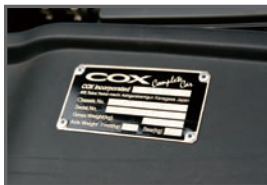
■Engine Room Plate