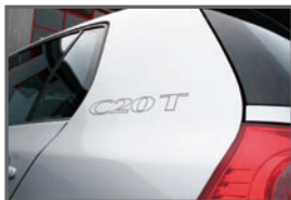
■Side C20T Sticker