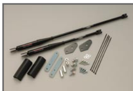
COX Body Damper (YAMAHA Performance Damper)