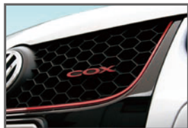
■Front COX Emblem (Red)