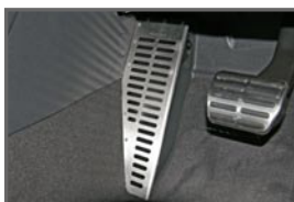
Foot Rest Cover