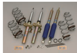
SS-3 Suspension Kit