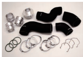
■H/D Turbo Pipe (4pcs)