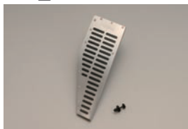
Foot Rest Cover