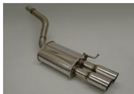
Stainless 1pcs Muffler