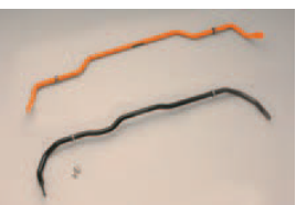
■Front Stabilizer(24φ) ■Rear Stabilizer