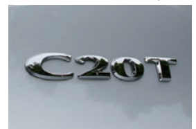
■Rear C20T Emblem