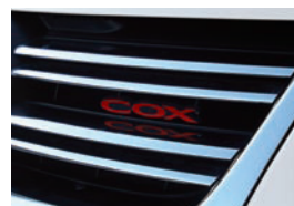
■Front COX Emblem (Red)