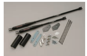
COX Body Damper (YAMAHA Performance Damper)