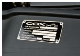
■Engine Room Plate