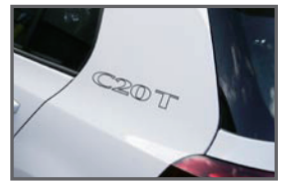
■ C20T Side Sticker