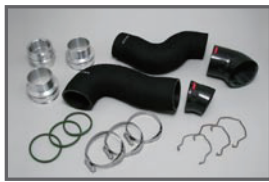
■ COX H/D Turbo Pipe (4pcs)