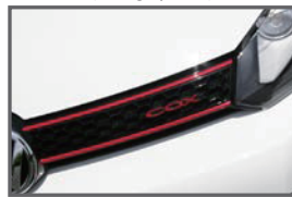
■ Front COX Red Emblem