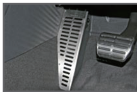
Foot Rest Cover