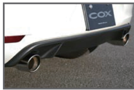
COX 2pcs Muffler