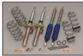
SS-3 Suspension Kit (Setting by COX)