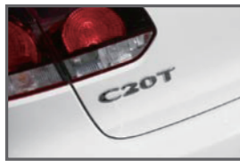
■ Rear C20T Emblem