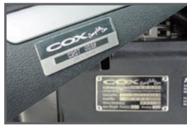
■ Interior Plate ■ Engine Room Plate