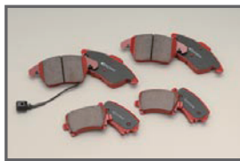
COX Brake Pads Kit