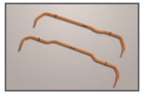
■ Stabilizer Fr(24φ)/Rr(22φ)