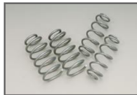
COX Original Spring Set