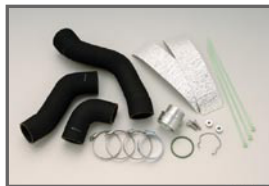
COX H/D Turbo Pipe