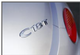
■Rear C18T Emblem