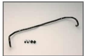
COX Front Stabilizer