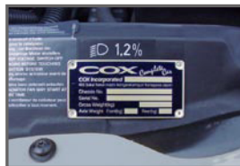
■Engine Room Plate