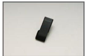
COX Accel Pedal Cover