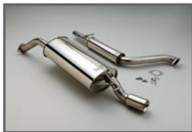
COX 2pcs Stainless Muffler