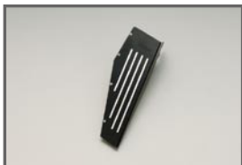
COX Foot Rest Cover